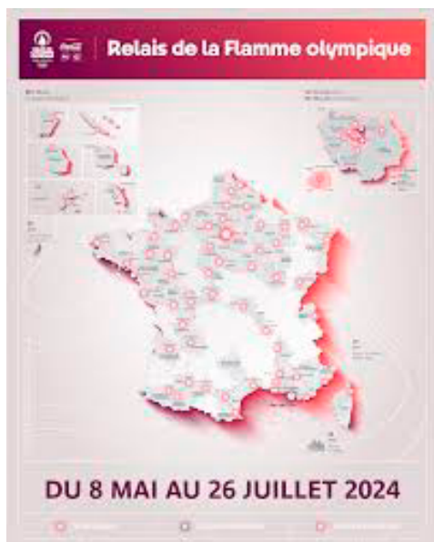
Schéma 1 : relais de la flamme olympique