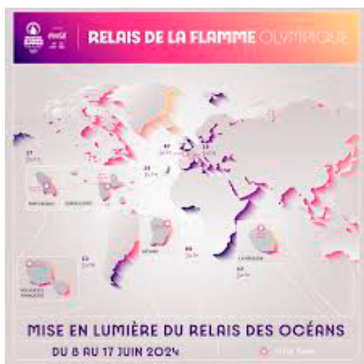
Schéma 3 : relais de la flamme olympique dans les territoires d'outre-mer

Pour réussir à vendre le plus de billets possibles pour les JP, les organisateur-rices n'ont pas axé leur communication que sur le sport et la performance des athlètes, mais aussi sur l'atout des sites touristiques de Paris.